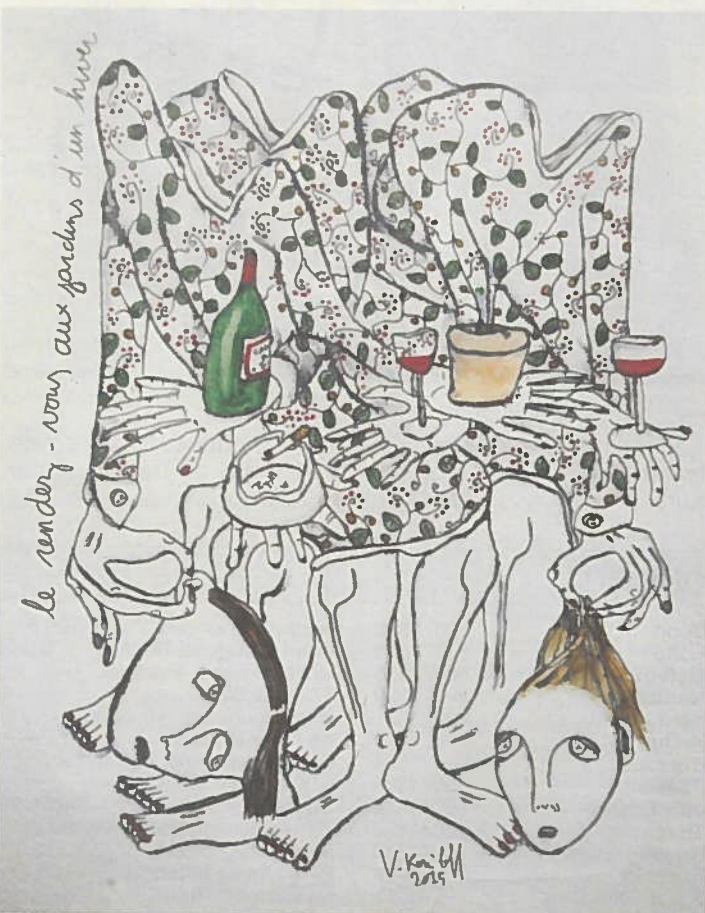
Vadim Korniloff: le rendez-vous aux jardins d'un hiver